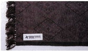
大島紬ストール 紫龍郷 [手織] ¥33,000 (税込)

アパレル、インテリア商品にしました。 特徴である精緻な柄模様と 絹織物の気品溢れる色柄、 しなやかな風合いをお楽しみください。