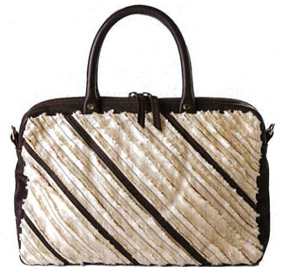
縞大島ハンドバッグ [ストラップベルト付] ¥44,000 (税込)