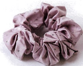
大島紬シュシュ [桃あられ] ¥5,500 (税込)