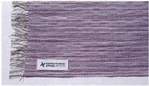
薩摩織ストール 薩摩すかし織 [手織] ¥27,500 (税込)